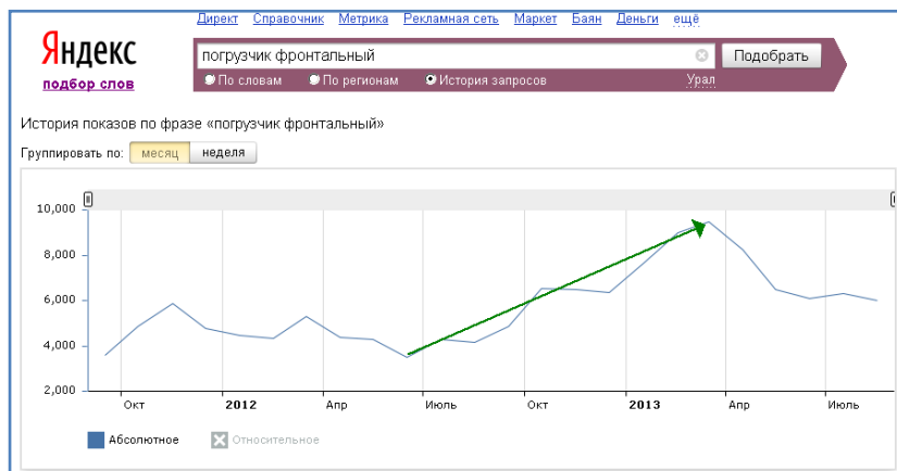
Пример сезонности спроса по запросу «погрузчик фронтальный»

С учетом сезонности спроса рекомендуем использовать контекстную рекламу с период с июля 2013 по май 2014 . Далее – в аналогичный период следующего года и/или для сообщения о спецпредложениях.